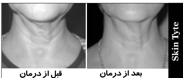
قبل از درمان