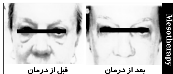
قبل از درمان