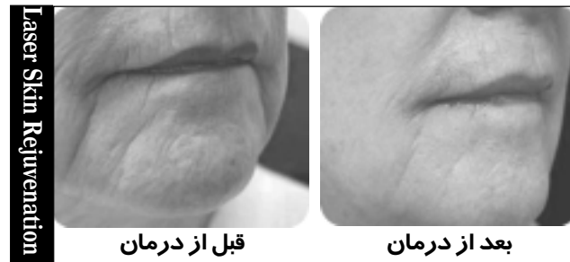
قبل از درمان