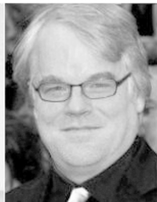
Philip Seymour Hoffman

آب در نیامد، بلکه مردم خدا دوست شرق تگزاس یک دفعه نه، ۵ دفعه پیاپی به آقای «ویلسون» رای دادند! بنا به گفته یکی از همکاران «چارلی»، مردم شرق تگزاس معتقد بودند که این مرد هر کاری کند «چارلی» ما است و به ما تعلق دارد! «چارلی» هم همیشه اظهار میکرد که همه میدانند که من کشیش روحانی و مقدسی نیستم! راز محبوبیت «چارلی» در آن بود که به هنگام نزدیک شدن انتخابات، با کاروان بزرگ و شخصی اش، ناحیه به ناحیه به مردم و مشکلات آنها مانند چک های بازنشستگی و خدمات به بازماندگان جنگی شخصاً رسیدگی میکرد و دل مردم را با شعارهای طنز آمیزش بدست میآورد. درست است که خیلی ها معتقد بودند که او مانند شخصیتی کارتونی است، ولی بنا به گفته بسیاری، «چارلی» آدمی زنگ و کتابخوان، قانون دان ماهر و چیره دستی است و پشت صحنه افکار سیاسی فوق العاده ای دارد و همیشه طرفدار ستم دیدگان و مظلومین است. برای او مجاهدین افغان از جمله این گروه رنجیده بودند، پس از اینکه او مقاله ای در باره پناهندگان شدن هزاران افغانی آواره را