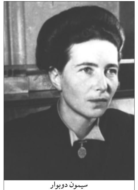
سیمون دو بووار

به موازات این امر، سیمون دو بووار از همکاران مجله «زمان