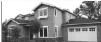
Mountain View. Brand New 4BR, 4.5BA, 3100 sq ft. Open Floor, High Ceilings, Guest Suite, High End Material & fixtures, Top Rated Los Altos Schools. Price: $2,048,000