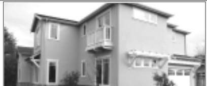
Mountain View. Brand New 4BR, 4.5BA, 3100 sq ft. Open Floor, High Ceilings, Guest Suite, High End Material & fixtures, Top Rated Los Altos Schools. Price: $1,998,000