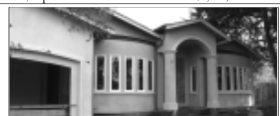
Saratoga. Brand New Single Story Home, 4BD/3BA, Office/Den, High Ceiling, Huge Master Suite Price $1,895,000