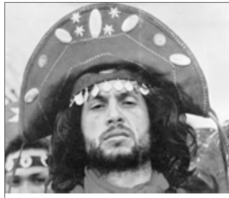
Black God, White Devil

از بهترین فیلم های موزیکال سینمای دنیا بود با حضور چندتن از فیلمسازان آنان. همین طور بخش «دنیای کارتون» که آخرین نمونه های فیلم های انیمیشن را به نمایش گذاشت. جشنواره همین طور به موزیک ویدیو و فیلم های ورزشی توجه