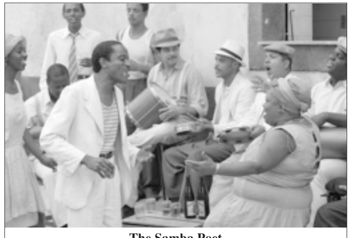
The Samba Poet