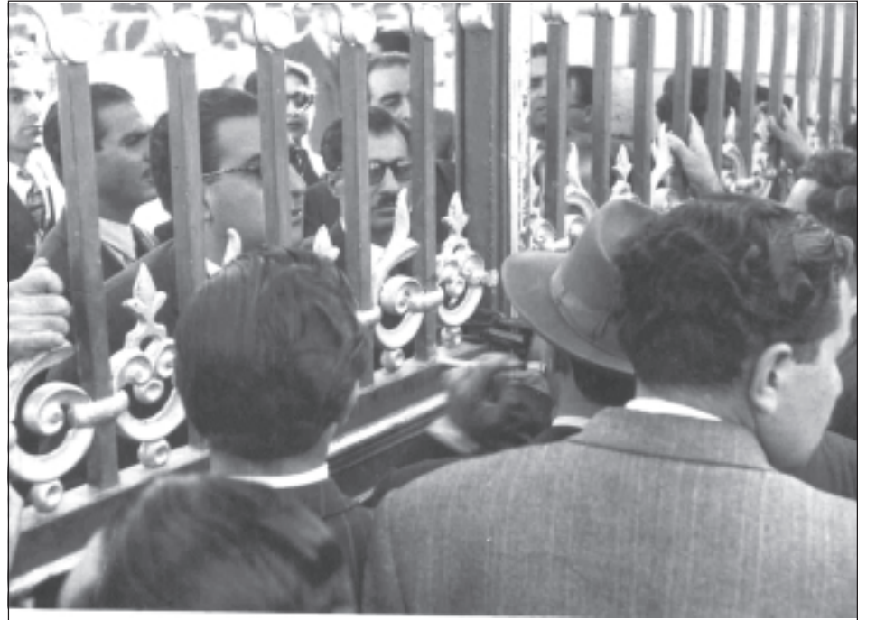
توقیف نمایشنامه قبل از اجرا در تئاتر سعدی

ادامه مطلب گروهی نبود که آدم بتواند از آن بگذرد و ورود من به این گروه ورود به دانشگاهی بسیار مهم بود. در این ایام در آن روزهایی که به وزارت بهداشت می رفتم، گاهی برای اجتماعات، برنامه هنری اجرا می کردم. از تمام حسابداران وزارتخانه ها دعوت شده بود که جامعه حسابداران را تشکیل بدهند. در حقیقت یک جمع صنفی به راه بیندازند. در آن شب مرا انتخاب کرده بودند که برای اختتامیه جلسه، قطعه هنری اجرا کنم. خوب من سالیان درازی بود که اصولاً پیش پرده یا قطعه اجرا نمی کردم؛ چون من در تئاتر سعدی مشغول بودم و مدت ها بود که پیش پرده نمی خواندم. بالاخره با وساطت رئیس روابط عمومی و اطلاعات وزارت بهداشتی از من خواستند از همان قدیمی ها یک برنامه اجرا کنم و بالاخره یکی از پیش پرده هایی را که در تئاترهای لاله زار سالهای ۲۴ و ۲۵ می خواندم، اجرا کردم. در ضمن برای این که غیبت های طولانی من در اداره برایم دردسر درست نکند، با وجودی که واقعا دوست نداشتم و برایم کهنه شده بود، مجبور بودم از این فعالیت ها بکنم. پیش پرده ای که خواندم و توقیف شدم شعری از پرویز خطیبی از زمان قدیم خواندم که به مدیر کل های وزارتخانه ها به خاطر دزدی های کلان و حیف و میل های اداری بد و بیراه می گفت. برنامه بی نهایت مورد استقبال قرار گرفت و مورد تشویق قرار گرفتم. غیبت های طولانی خودم را با این کارها صاف می کردم. فردای آن روز قبل از ظهر طبق معمول به تئاتر سعدی رفتم. جلوی تئاتر با چند نفر از بچه های تئاتر سعدی و برادران صاحب تئاتر جمع