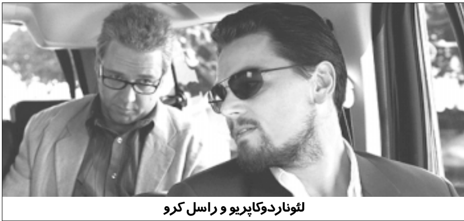
لئوناردو کاپریو و راسل کرو

دهند، مطرح کند. سبک فیلمسازی او هر چند مسایل سیاسی را به میان می کشد، صرفاً بهره برداری از آن برای ایجاد اکشن است. برای همین نمی توان فیلم های او را در رده ساخته های سیاسی قرار داد، هر چند ممکن است چنین مسایلی را مطرح کند. تا این حد، آثار او موفق و تماشایی است و تماشاگران فیلم های پرتحرک را خوش می آید. اما برای تماشاگر جدی تر، که به ورای این صحنه های پرهیجان نگاه می کند، فیلم های او فاقد بنیاد مسئولانه است که از چنین موضوعاتی صرفاً سوءاستفاده می کند و قصد ندارد به کنکاش یا موشکافی مسایلی که مطرح می کند بپردازد. این دومین فیلم در ماه های اخیر است که درباره خاور میانه با بودجه ای عظیم از هالیوود صادر میشود. فیلم نخست «پادشاهی» بود که وقایعش در عربستان سعودی اتفاق می افتد. BODY OF LIES، یکایک کشورهای منطقه را بجز ایران در بر میگیرد، و ایران را هم از طریق یک شخصیت ایرانی (پرستار ایرانی ساکن اردن که می گوید از پدری ایرانی است) که جمع این کشورها می آفراید. درباره جنجالی که پیرامون «گلشیفته فراهانی» که بعد از ساختن این فیلم ممنوع الخروج اعلام شد، ایجاد گردید بالطبع خیلی ها را به این فیلم جلب کرد که دستگاه های تبلیغاتی - دولتی سینمای ایران، مجدداً نقش خود را به خوبی بازی کرد! «گلشیفته فراهانی» ضمتاً دختر «بهزاد فراهانی» بازیگر و کارگردان تئاتر و خواهر «شقایق فراهانی» بازیگر است. فیلم نخست او «زیر درخت گلابی» به کارگردانی «داریوش مهرجویی» بود که در سن ۱۴ سالگی بازی کرد. فیلم های دیگرش: بوتیک، سنتوری (مهرجویی)، «ماه نیمه» (بهمن قبادی)... است، و آخرین فیلمش «م مثل مادر» (رسول ملاقلی پور) است که فیلم ارسالی ایران به «اسکار» هم هست.