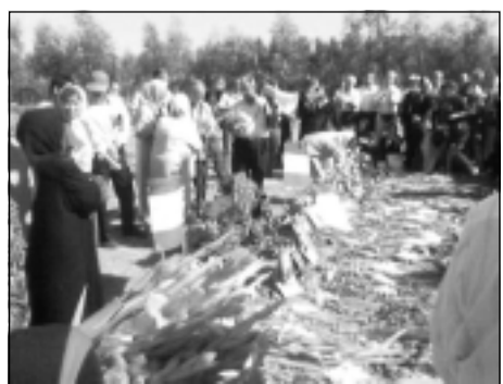
خانواده قربانیان در بخشی از گورستان خاوران

خاوران باید پس از روشن شدن محل دفن اعدام شدگان در خاوران انجام گیرد، چرا که به درستی نگران بودند که هرگونه اقدامی می تواند شواهد موجود در خاوران را از بین ببرد. در سالهای اخیر بخشی از خانواده ها با توجه به اهمیت حفظ خاوران اقداماتی را انجام دادند.